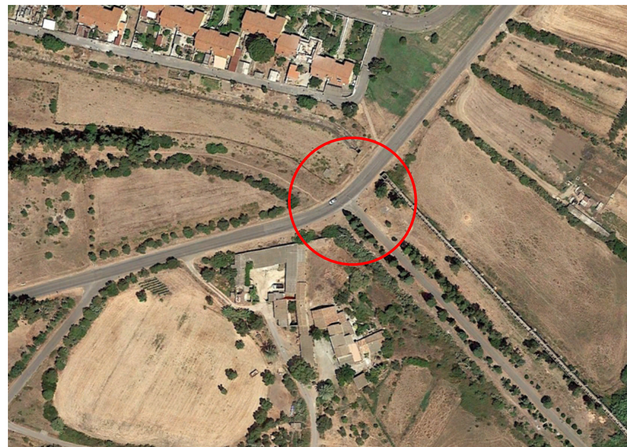
VISTA GENERALE CON AREA DI INTERVENTO

Approvazione: Del. G.P. n. _____ del _____